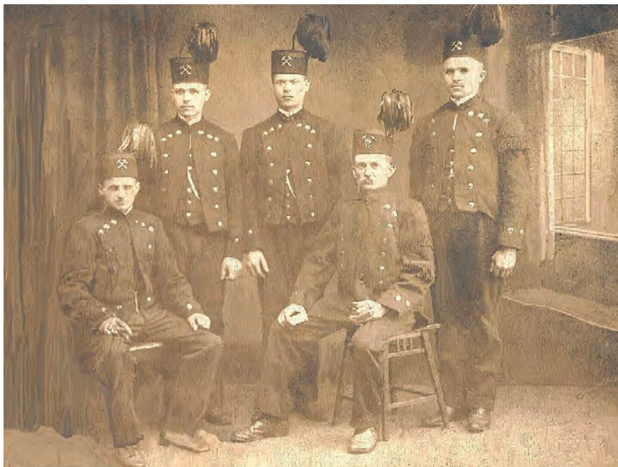
Ryc. 3. Górnicy kopalni „Nowa Przemsza”, 1920 r. (Kokot, 2002)

Dogodne położenie kopalni w pobliżu rzeki Przemsza pozwalało na transportowanie węgla drogą wodną (ryc. 4). Przewożono go galarami do Małopolski przez długi czas, do końca XIX w., nawet po budowie linii kolejowej, ze względu na niski koszt transportu (Sulik, 2007).