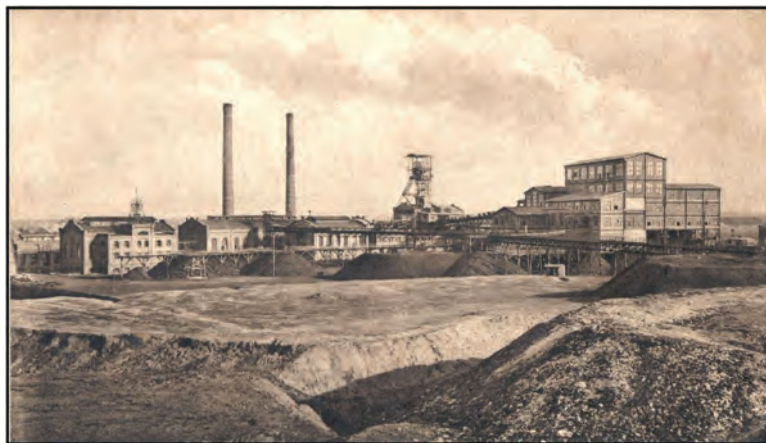
Ryc. 1. Kopalnia „Nowa Przemsza”, rok 1920 (Kokot, 2002)

Obszar górniczy kopalni „Nowa Przemsza” (nazywany dalej obszarem badań) położony jest w środkowo-wschodniej części miasta Mysłowice, znajdującego się w środkowo-wschodniej części województwa śląskiego. Według podziału fizyczno-geograficznego Polski (Kondracki, 2002) miasto znajduje się we wschodniej części Wyżyny Śląskiej, w obrębie dwóch mezoregionów: Wyżyny Katowickiej i Pagórów Jaworznickich. Powierzchnia obszaru badań wynosi około 12 km 2 . Jego zachodnia część wznosi się na wysokości 300–310 m n.p.m. i opada w kierunku wschodnim, do koryta rzeki Przemszy, do wysokości 240 m n.p.m. Obszar badań obejmuje następujące dzielnice Mysłowic: Brzezinka, Brzęczkowice, Mysłowice Las, Kosztowy.