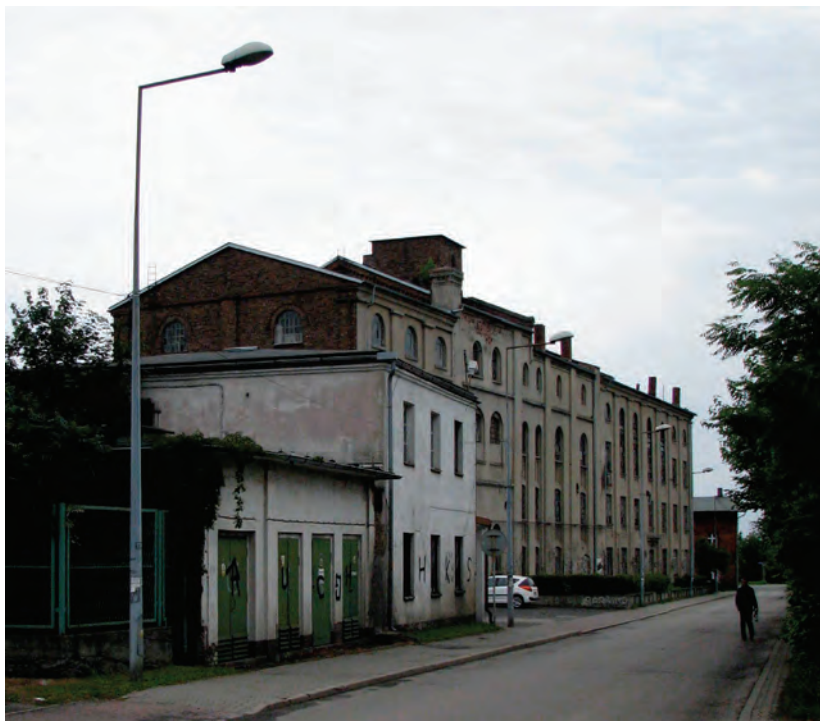
Ryc. 5. Kopalnia „Nowa Przemsza” – budynek szybu „Franciszka” (stan na 2018 r.) Fig. 5. The “Nowa Przemsza” coal mine – building after former mining shaft „Franciszka” (as for 2018)

i kontynuuje swą działalność pod inną nazwą oraz w innym zakresie, jednak dzięki temu znaczna część budynków kopalni została zachowana, m.in. budynki po szybach Paweł i Franciszka (ryc. 5).