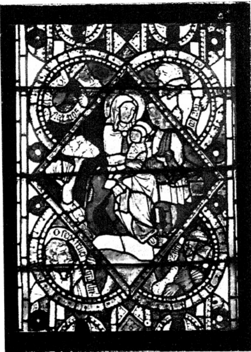
16. ŚW. RODZINA WRACA Z EGIPTU. (III. 38—199.)