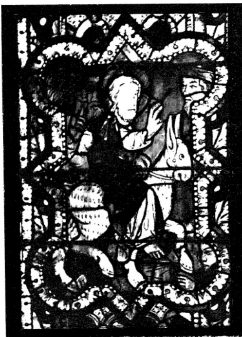
12. WJAZD DO JEROZOLIMY. (I. 34—118.)