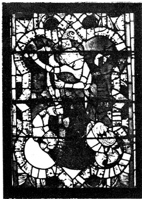
14. ŚW. MAŁGORZATA. (III. 41—200.)