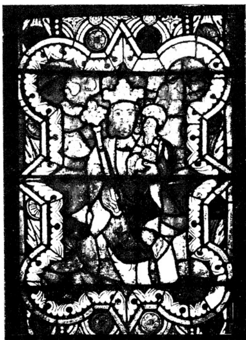
3. WNIEBOWZIĘCIE N. P. MARJI. (I. 40—90.)