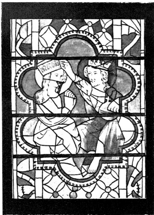
13. KORONACJA N. P. MARJI. (I. 23—107.)