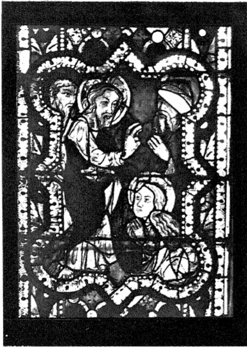
5. CHRYSZTUS ODPUSZCZA GRZECHY MARIJI MAGDALENIE. (I. 36—120.)