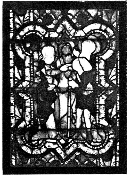
6. UZDROWIENIE ŚLEPEGO ŻEBRAKA. (I. 37—117.)