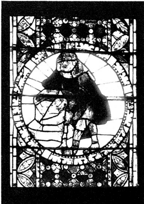
7. RUBEN PRZY STUDNI. (III. 37—198.)