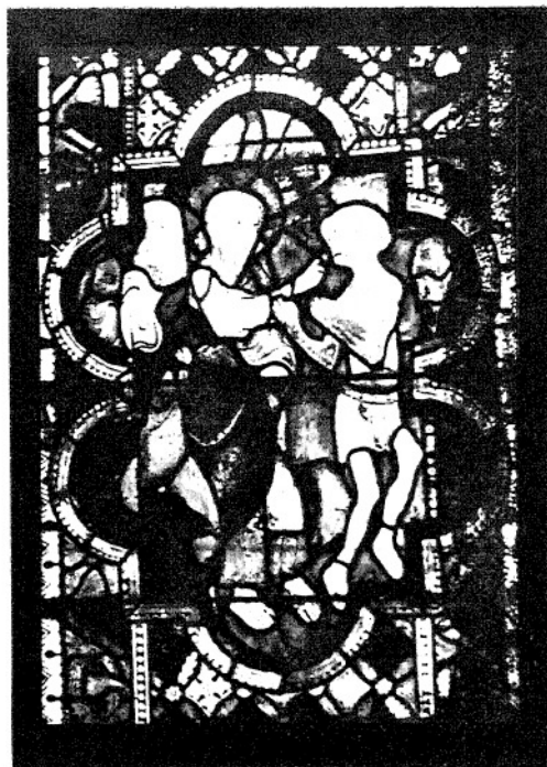
10. WYPĘDZENIE CZARTA Z OPĘTANEGO. (I. 35—119.)