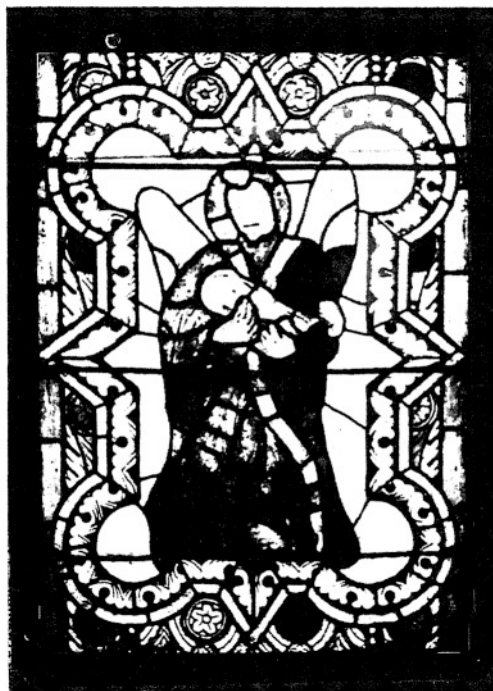
4. ANIOŁ GRAJĄCY. (I. 42—86.)