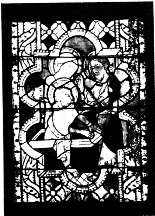
11. WSKRZESZENIE ŁAZARZA. (I. 38—116.)