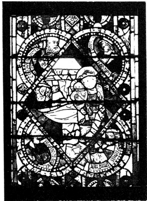
8. NARODZENIE CHRYSZTUSA. (III. 42—197.)