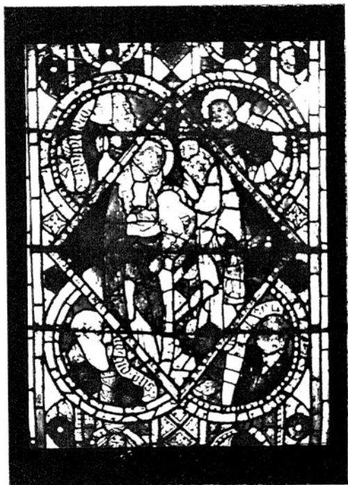
15. OFIAROWANIE W ŚWIĄTYNI. (III. 40—201.)