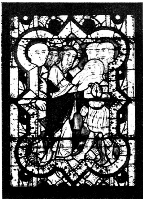
9. UZDROWIENIE GŁUCHONIEMEGO. (I. 39—115.)