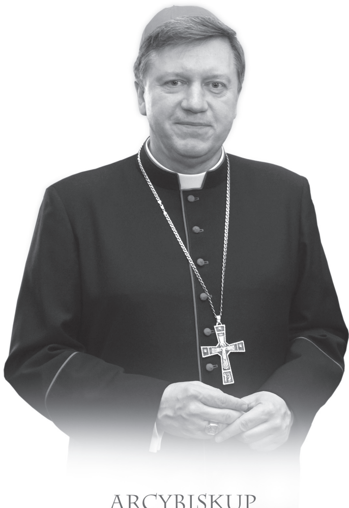
ARCYBISKUP JÓZEF KUPNY