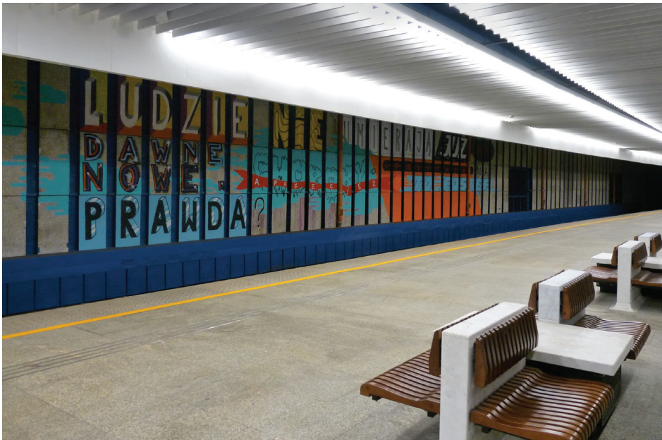
Il. 1. Mural „The Writers” na ścianie peronu 4 Dworca Centralnego w Warszawie