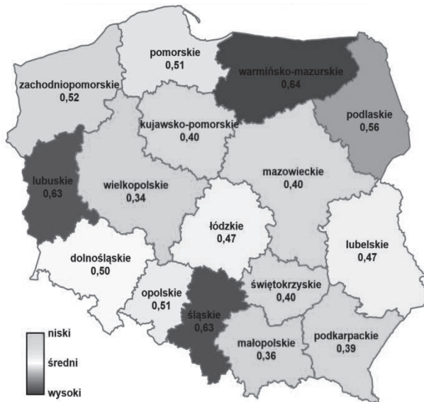
Rys. 5. Wskaźnik przestępczości przeciwko życiu i zdrowiu