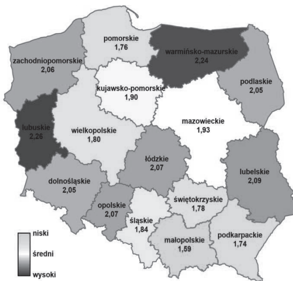
Rys. 4. Wskaźnik przestępczości o charakterze drogowym