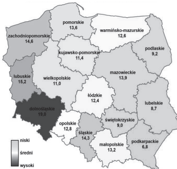
Rys. 2. Wskaźnik przestępczości o charakterze kryminalnym