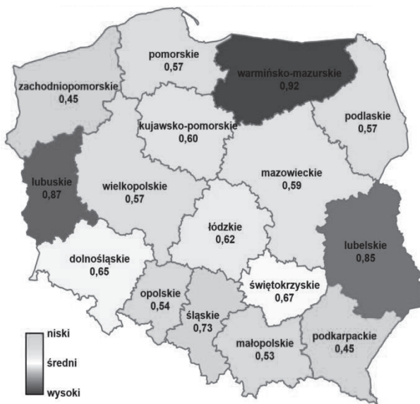
Rys. 8. Wskaźnik przestępczości przeciwko rodzinie i opiece