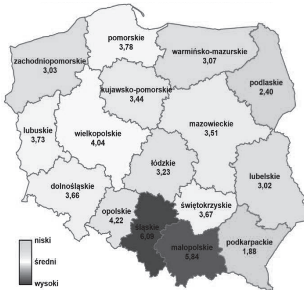
Rys. 3. Wskaźnik przestępczości o charakterze gospodarczym