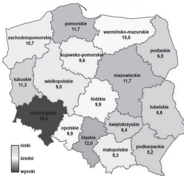
Rys. 6. Wskaźnik przestępczości przeciwko mieniu