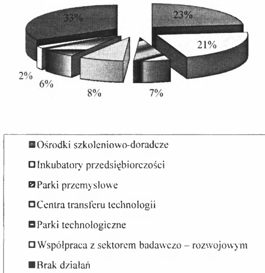
Rys. 1. Instytucjonalne instrumenty wspierania przedsiębiorczości stosowane przez jednostki administracji samorządowej regionu Polski Wschodniej (% wskazań)