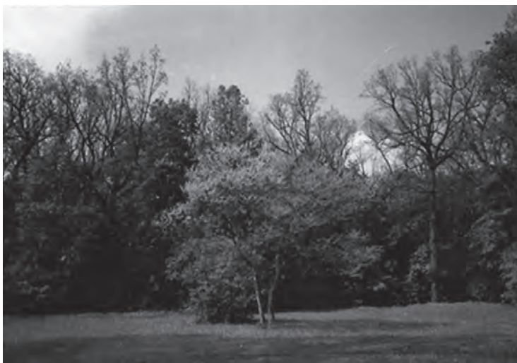
Рис. 1. 65-летние растения C. canadensis на Китайской поляне дендропарка «Софиевка»

Растения C. canadensis ежегодно цветут и плодоносят. Во время цветения они приобретают оригинальный вид и особенную привлекательность, благодаря чему они есть перспективными для использования в зеленом строительстве (рис. 1).