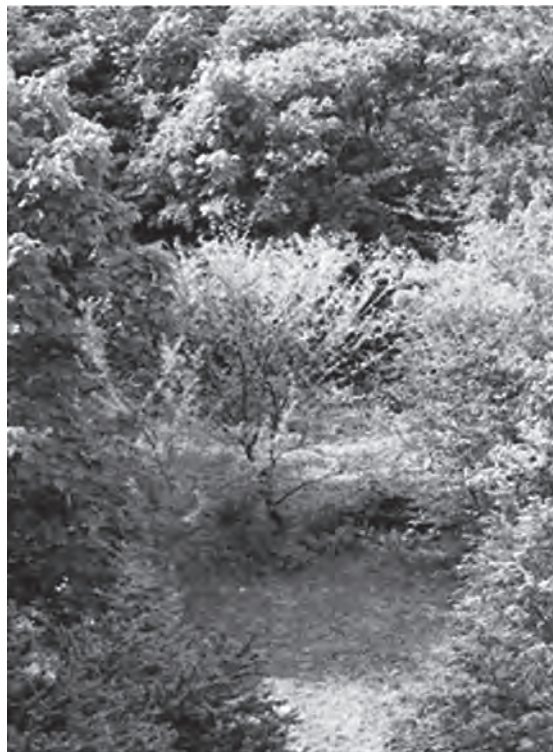
Рис. 2. C. chinensis в насаждениях дендропарка «Софиевка»